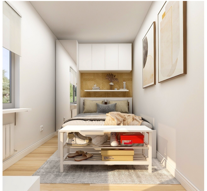
Sovrum med fint ljusinsläpp.

Observera att interiört är det ett framtaget förslag på hur man kan möblera.