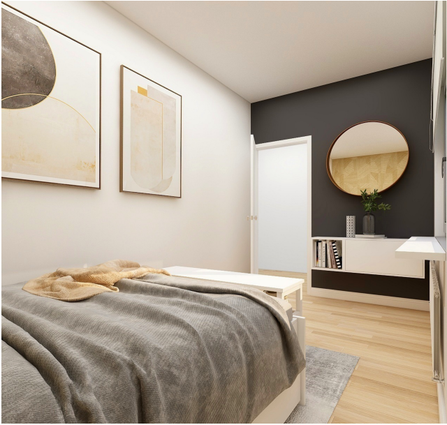
Sovrum med parkettgolv.