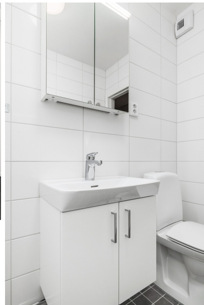
Badrum som har handfat med kommod och spegelskåp.