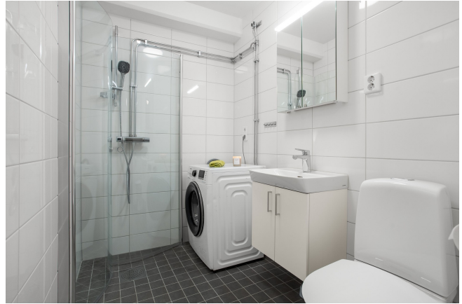
Smakfullt kaklat badrum med klinkergolv med golvvärme. Inrett med tvättmaskin och dusch som har vikbara duschväggar.