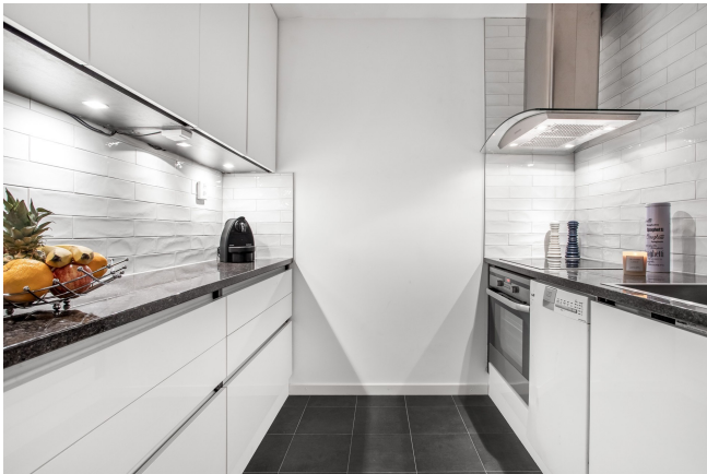
Praktiskt kök från Puustelli, inrett med kakel över arbetsytorna och med klinker på golvet.