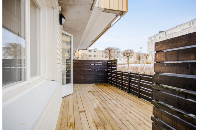
Inhägnad stor altan med läge i sydväst. Nylagd och tryckimpregnerad altan.