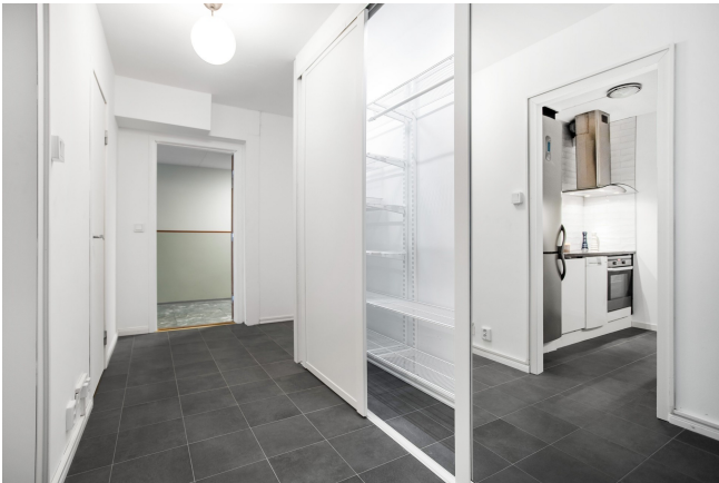
Hall med klinkergolv och skjutbara spegeldörrar.