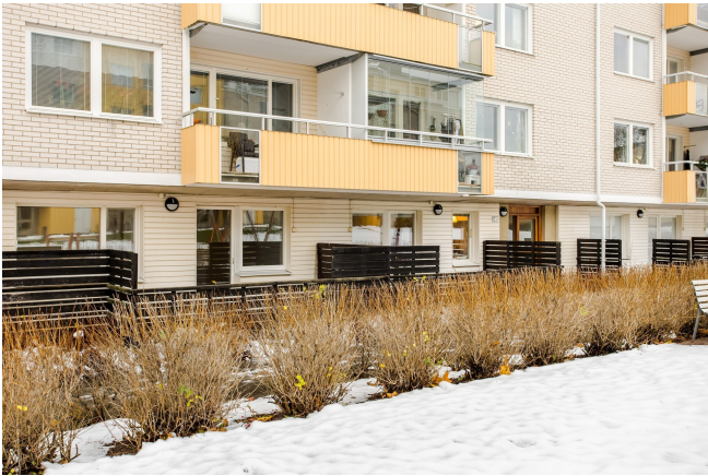
Lägenhet med uteplats