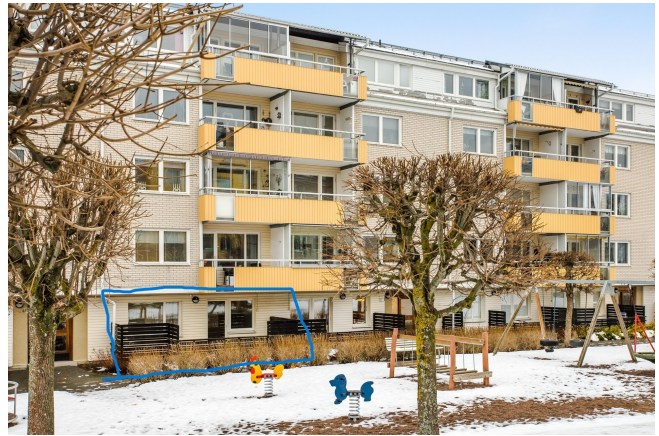
Stor trädgård med lekplats, boulderbana och grillplats inryms inom föreningens härliga grönytor.