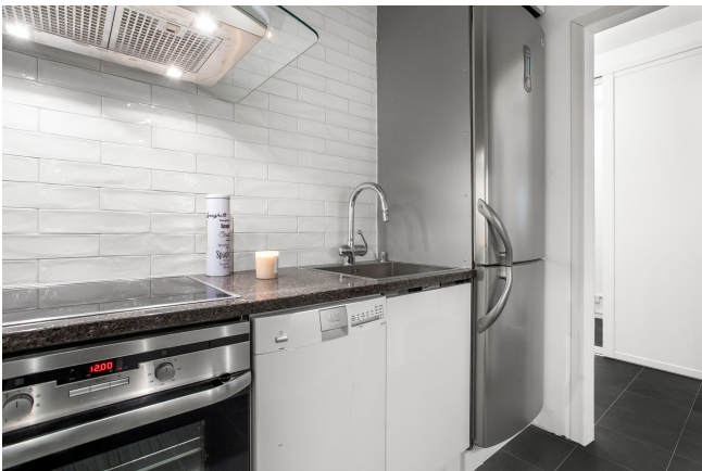
Kök med maskinell utrustning från AEG; spishäll, ugn, diskmaskin och kyl/frys. Fläkt från Lapetek.