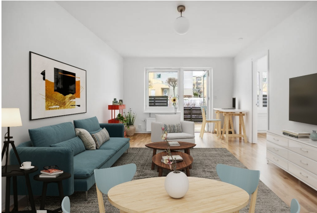
Generöst vardagsrum med parkettgolv. Utgång till altan i sydväst.