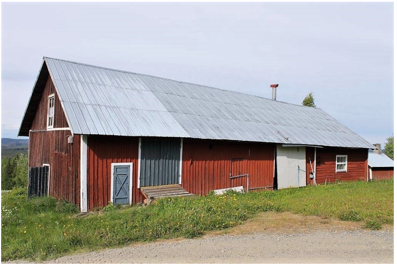
Ladugård (Övre delen)