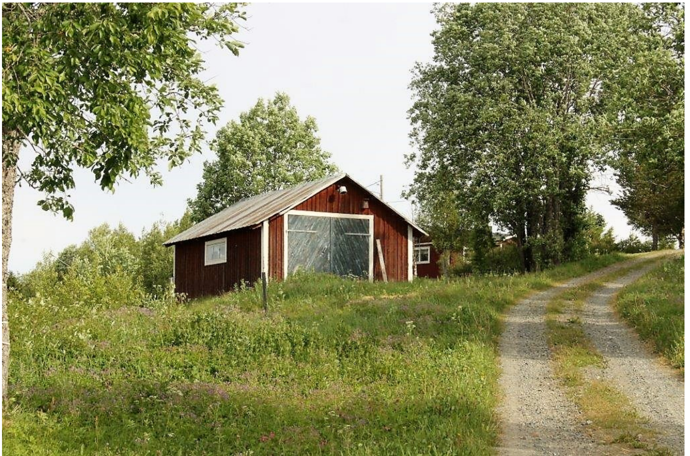
Förrådshus (Övre delen)