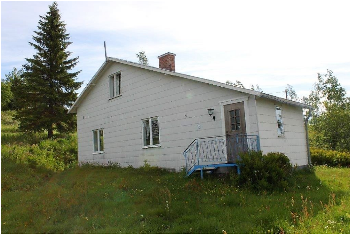
Huvudbyggnad (Övre delen)