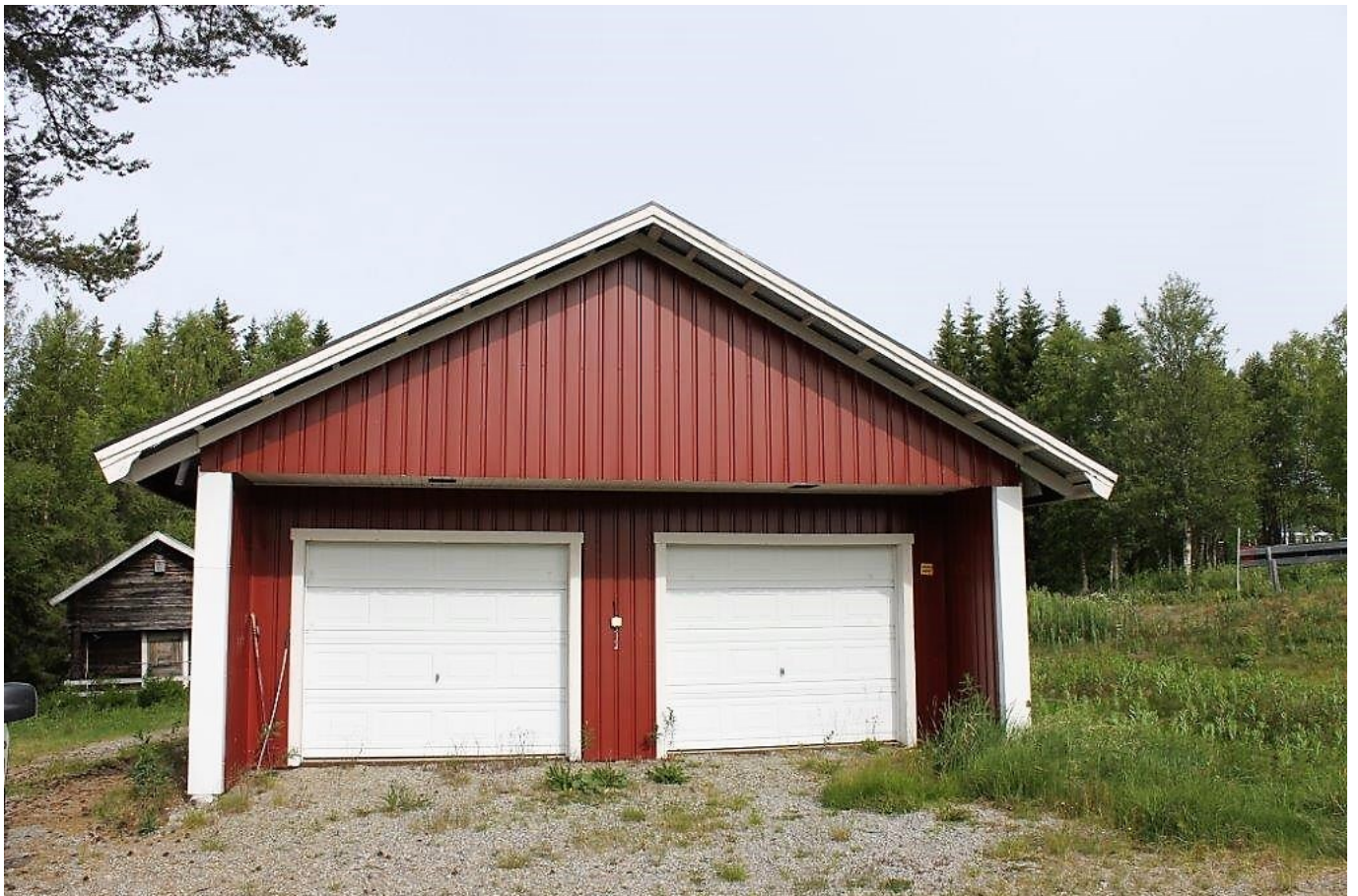
Dubbelgarage (nedre delen)