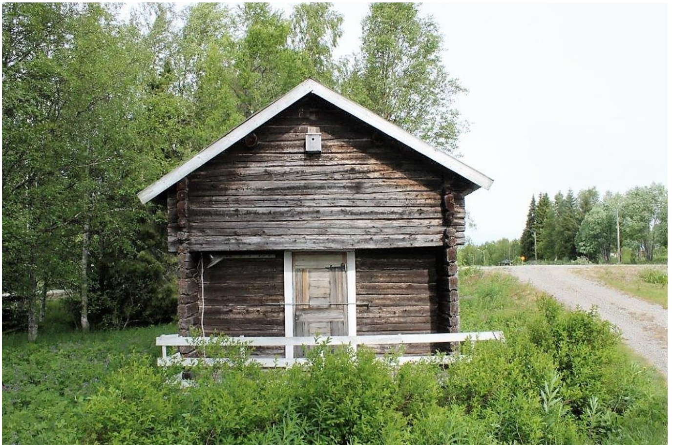
Härbre (nedre delen)