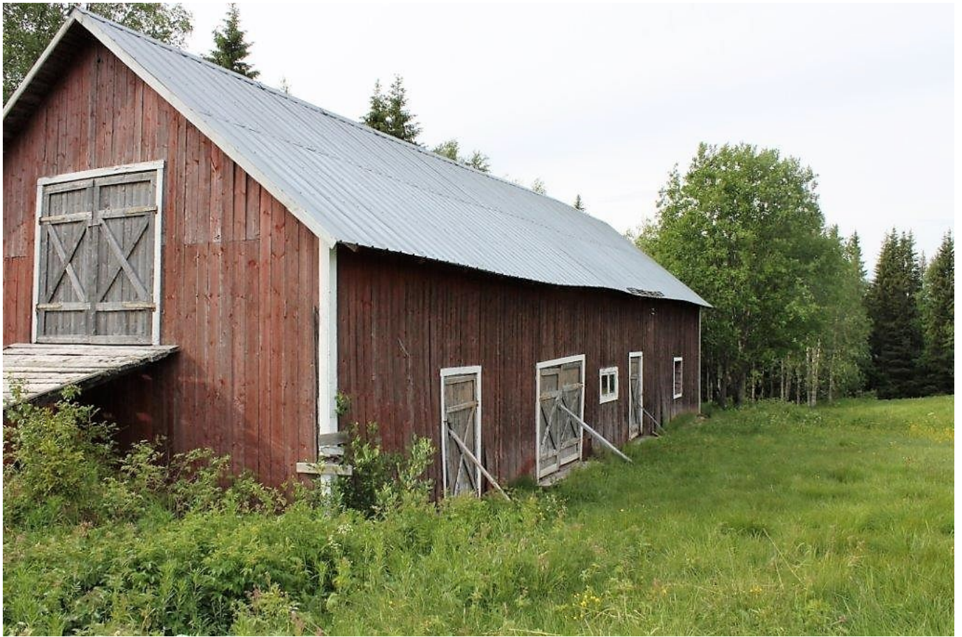
Ladugård (nedre delen)