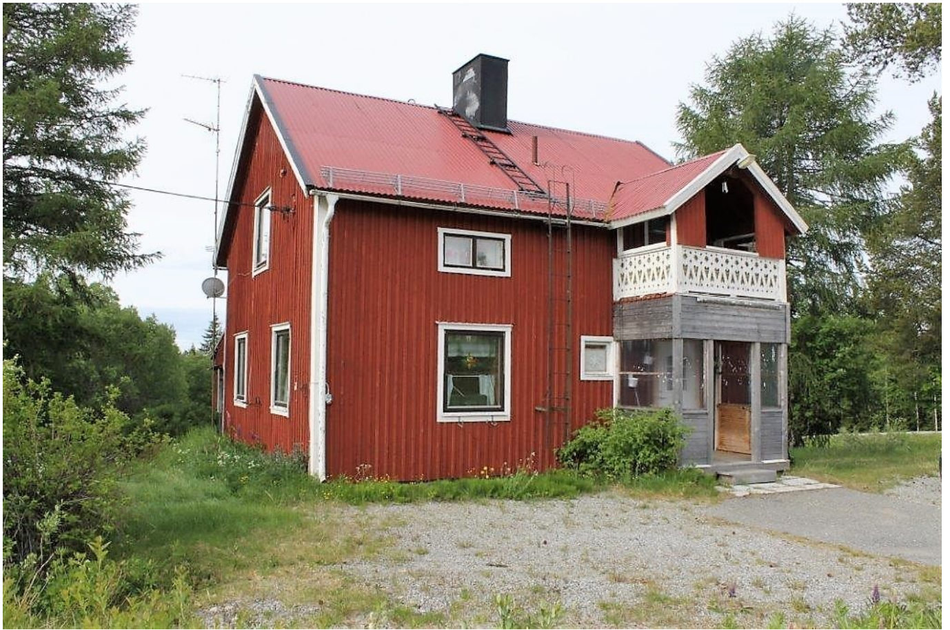
Huvudbyggnad närmast storvägen (nedre delen)