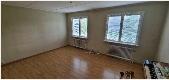
Bostadshus, vardagsrum, öv