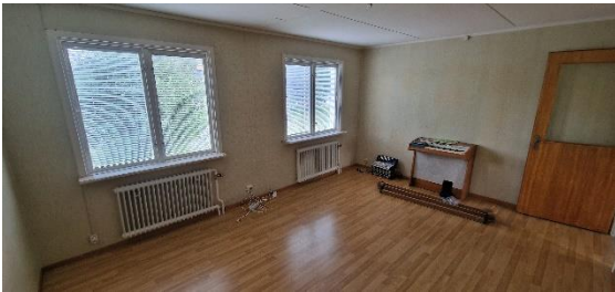
Bostadshus, vardagsrum, öv