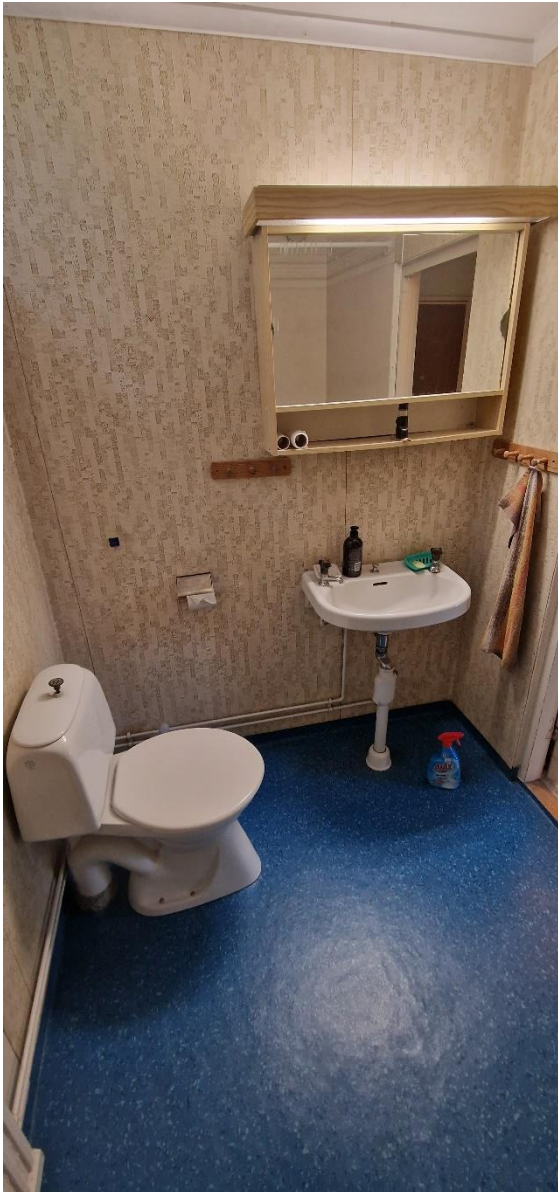
Bostadshus, badrum, wc, tvättstll och överskåp, nv