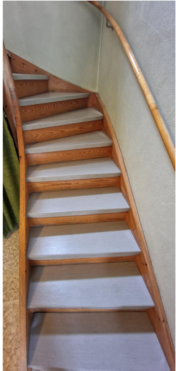
Bostadshus, trapp mellan nv och öv