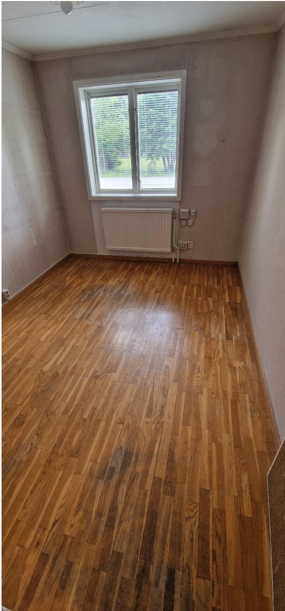
Bostadshus, sovrum 2/kontor, nv