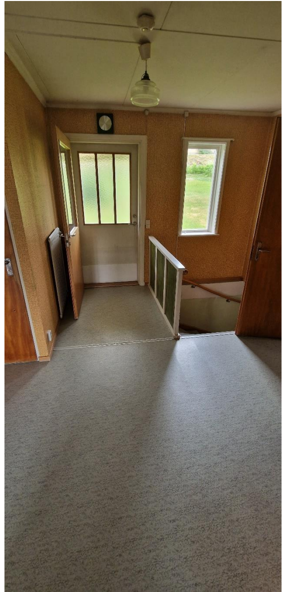
Bostadshus, hall, in- och utgång, öv