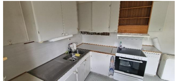
Bostadshus, kök, öv