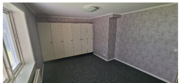
Bostadshus, sovrurn 1, nv