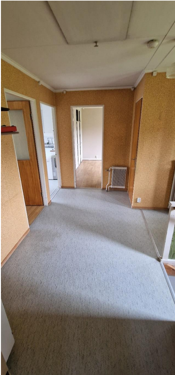
Bostadshus, hall m.m, öv