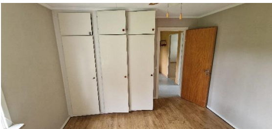
Bostadshus, sovrum 1, öv