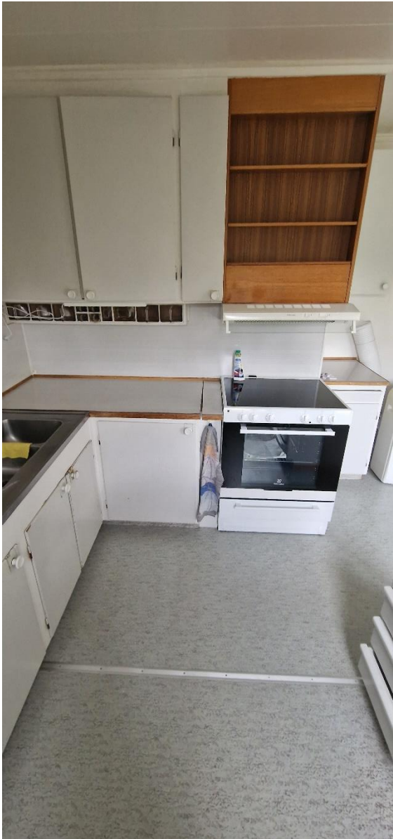
Bostadshus, kök, öv