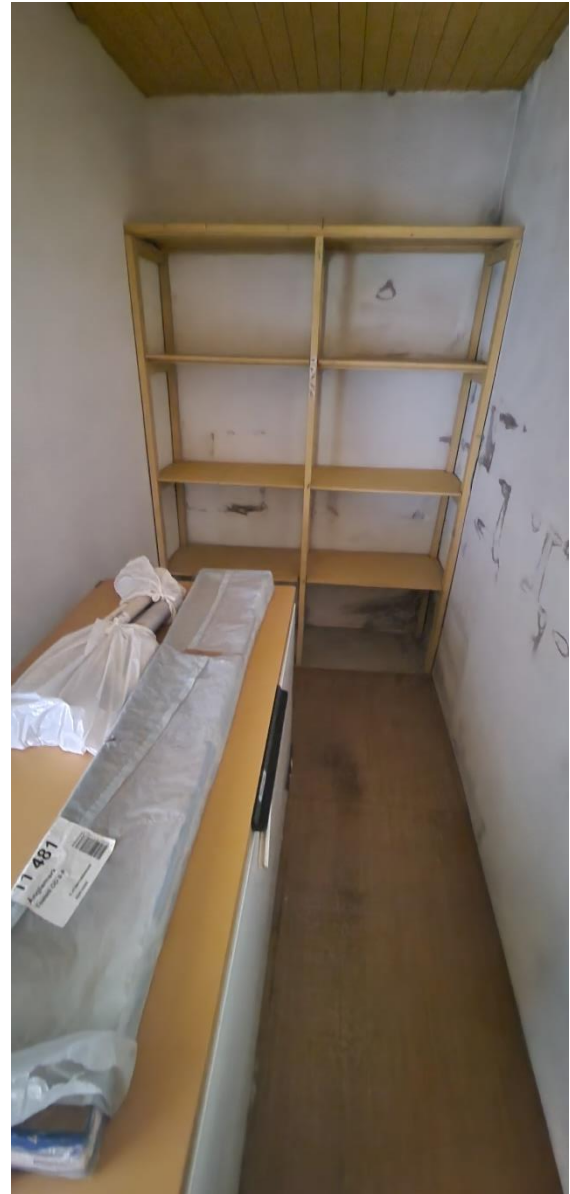
Bostadshus, förråd, frysbox, nv