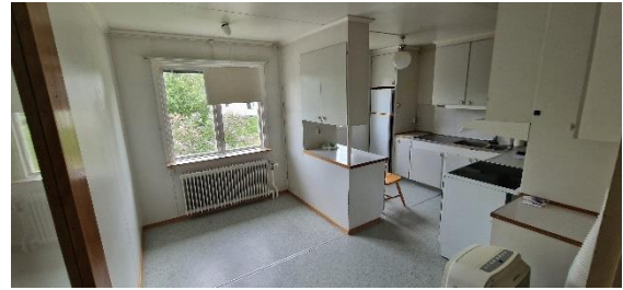
Bostadshus, kök, öv