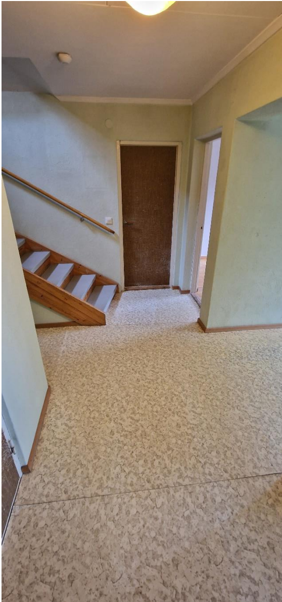
Bostadshus, hall, nv