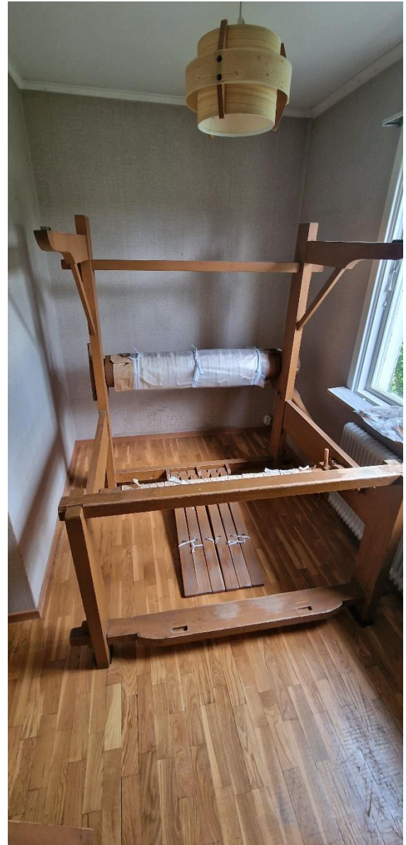
Bostadshus, sovrum 2, öv