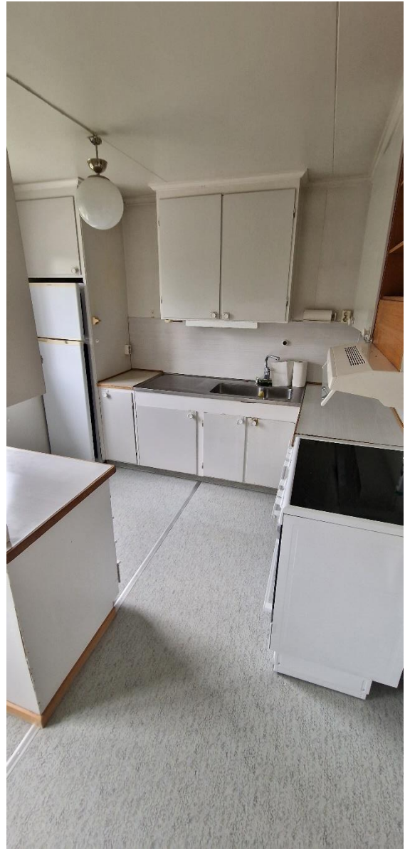
Bostadshus, kök, öv