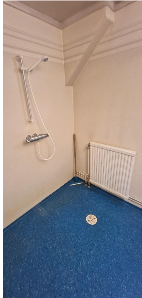
Bostadshus, badrum, dusch, nv