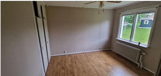
Bostadshus, sovrum 1, öv