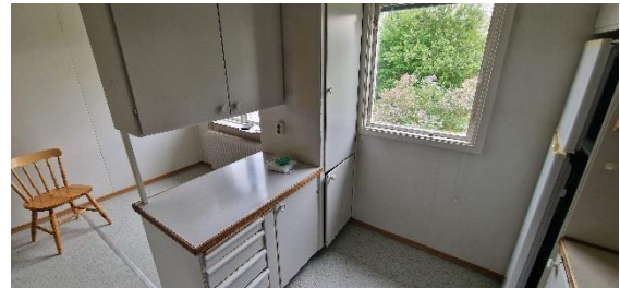
Bostadshus, kök, öv