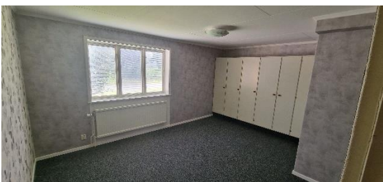
Bostadshus, sovrurn 1, nv