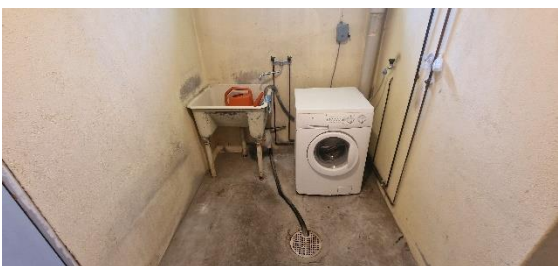
Bostadshus, tvättstuga, tvättmaskin och tvättho, nv