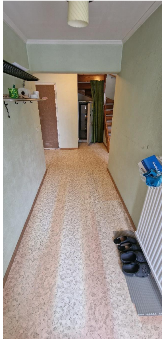
Bostadshus, hall, in- och utgång, nv