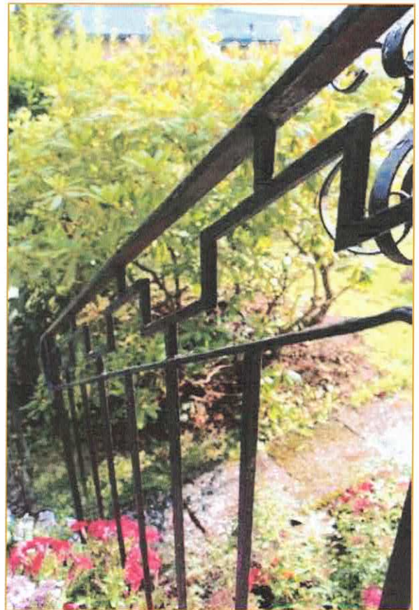
Näcken 28. Trappräcke av svartmålat järn.