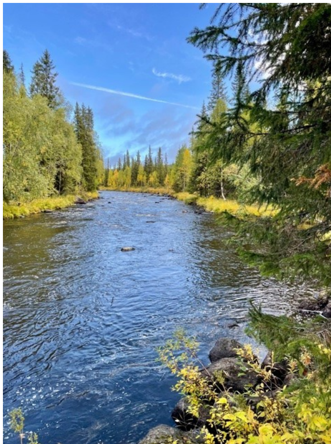
Bäcken som rinner genom avdelning 15