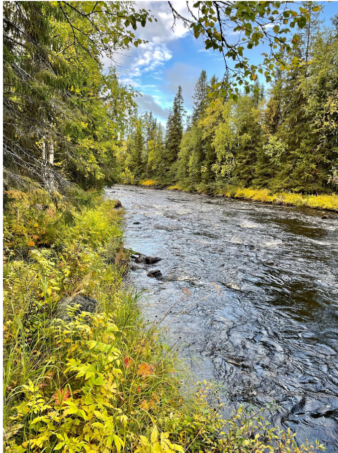
Bäcken som rinner genom avdelning 15