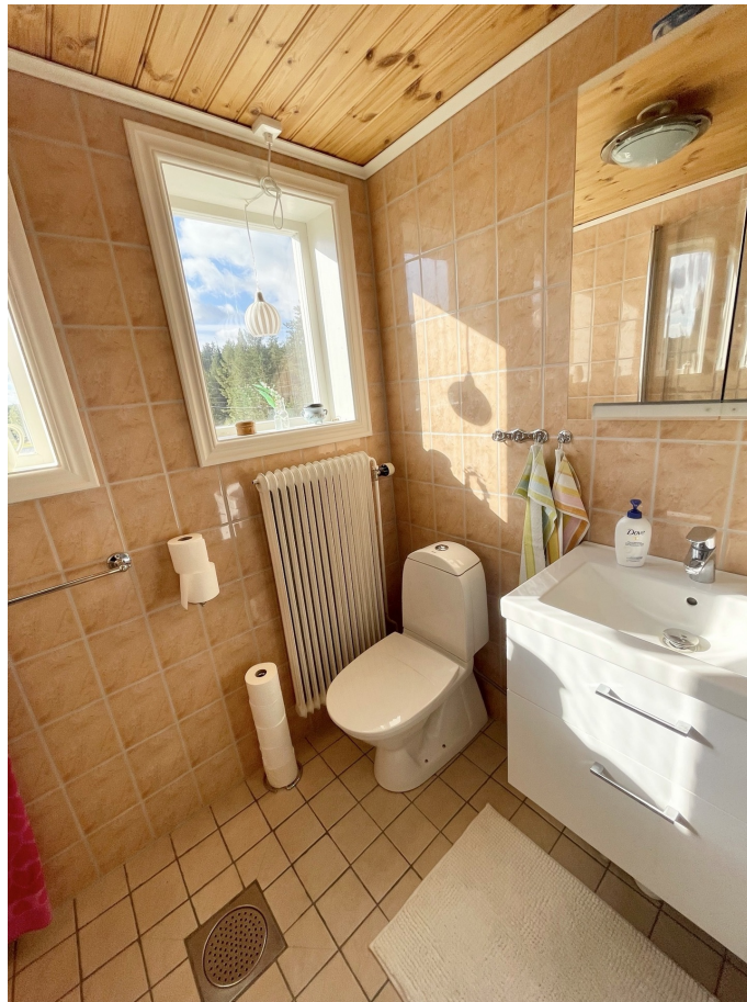
Badrum - övervåning