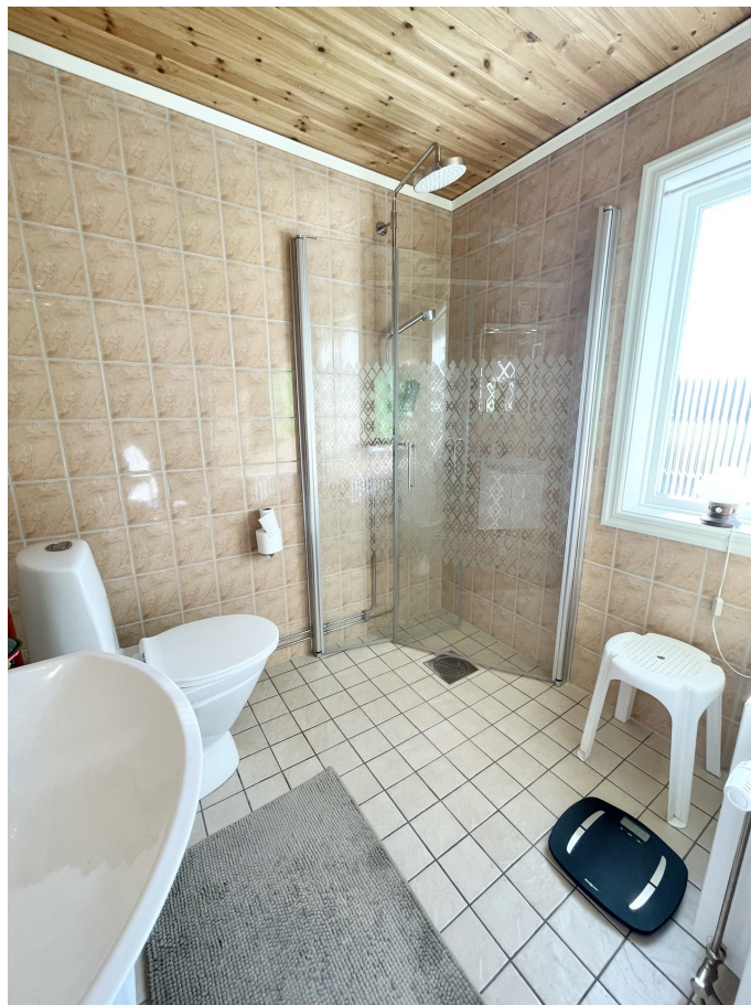
Badrum - Bottenplan