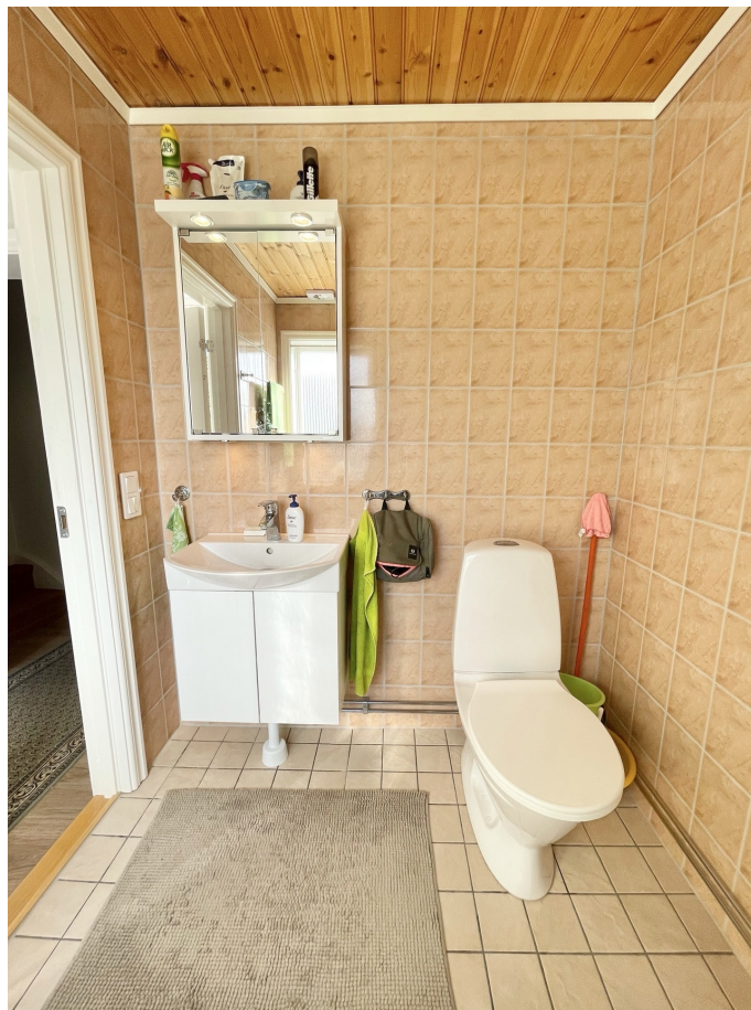
Badrum - Bottenplan