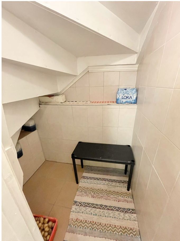
Förråd - Källare