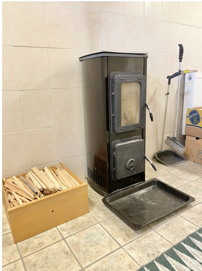
Värmekamin - Källare