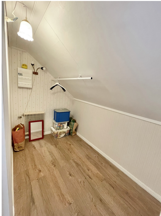
Sidoalkov - Bra förvaring