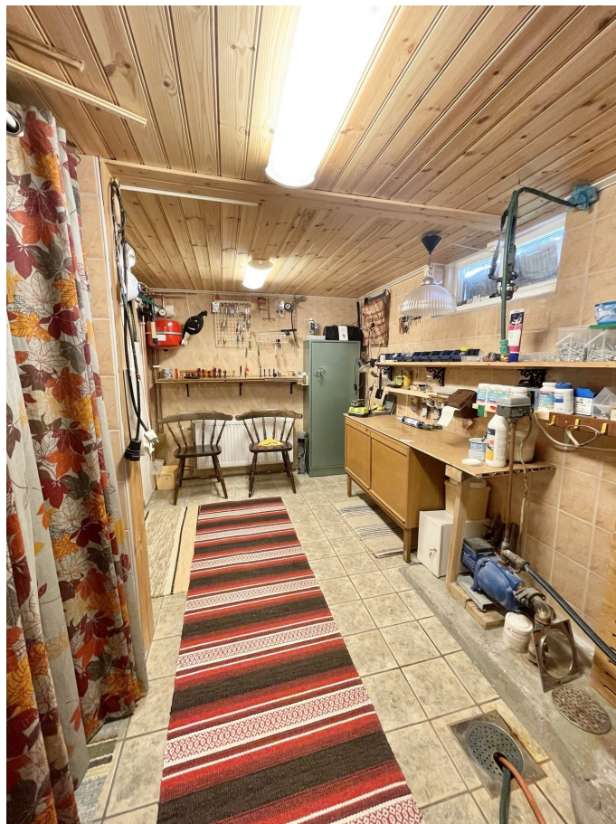
Verkstad - Källare