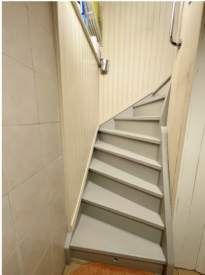
Trapp - Källare