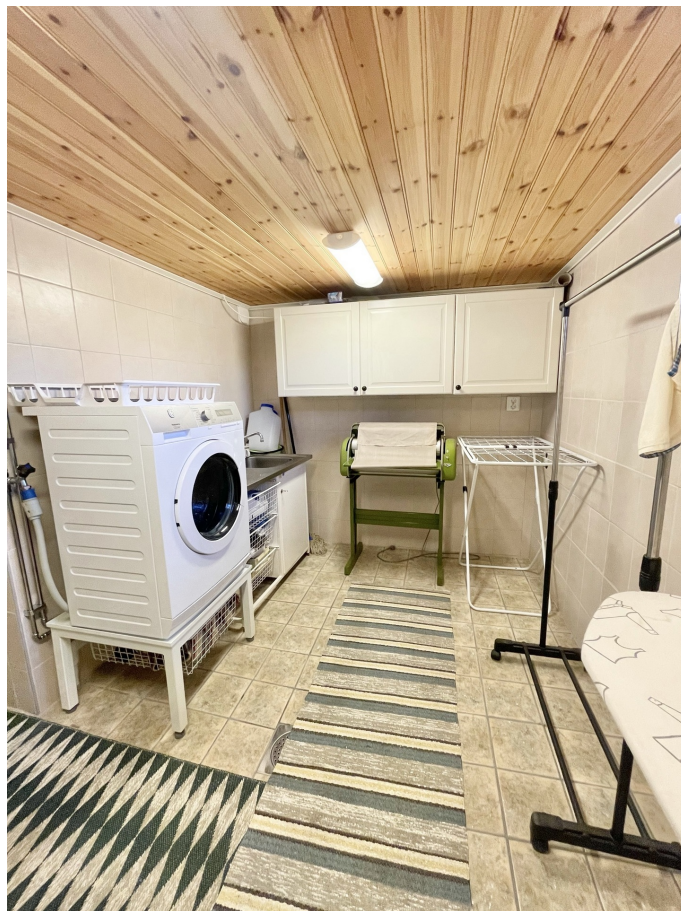
Klädvård - Källare