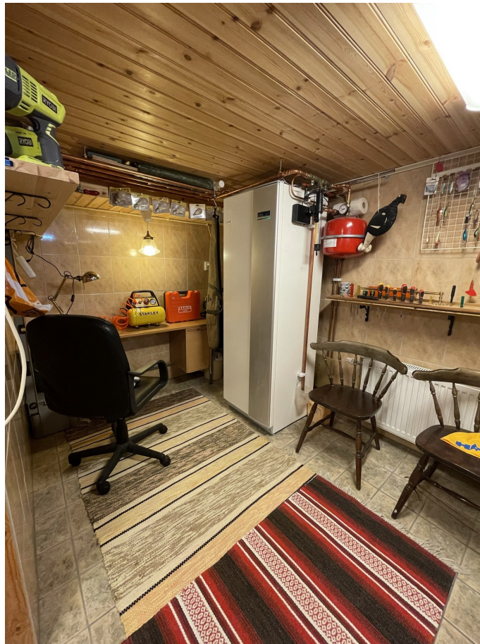
Värmepump från NIBE