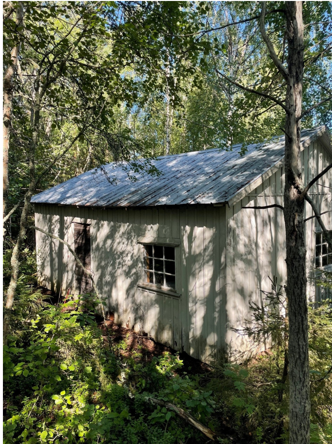
Litet hus på fastigheten