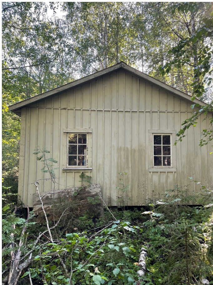
Litet hus på fastigheten