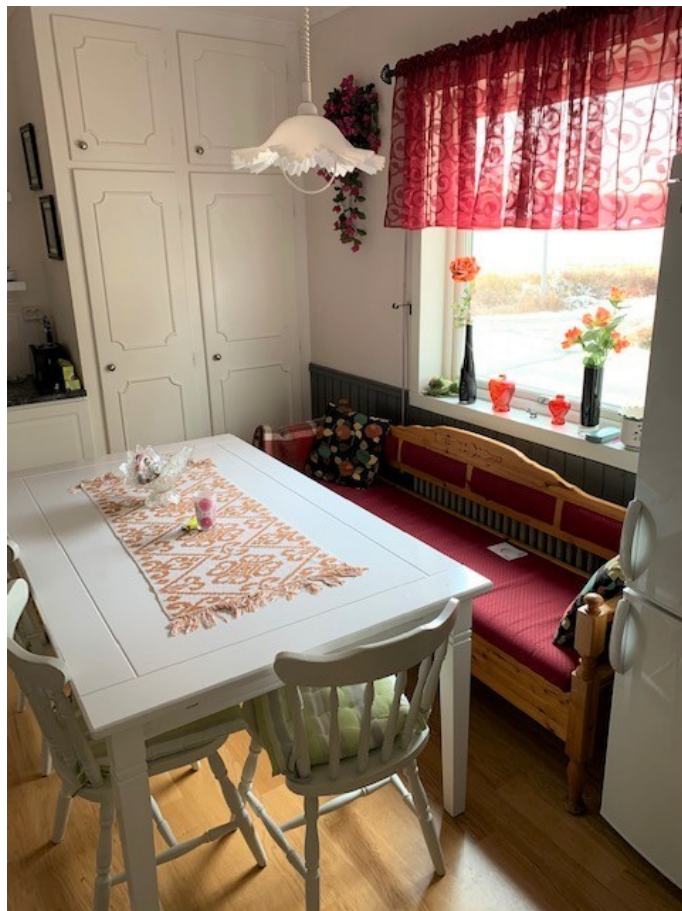
Kök / Matplats