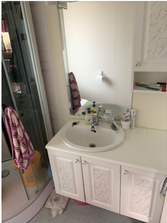
Toalett med dusch & tvättställ