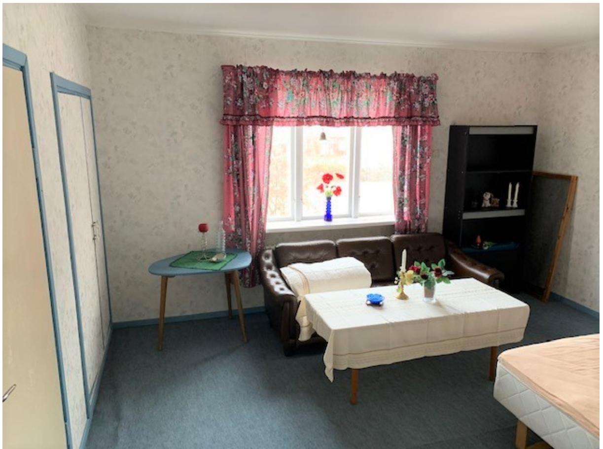
Vardagsrum /sovrums Övervåning