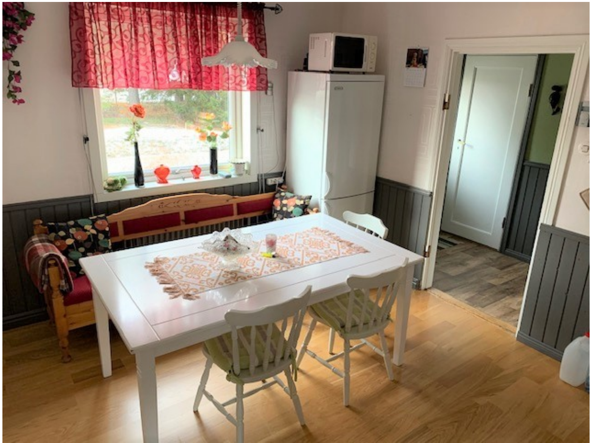
Kök / matplats