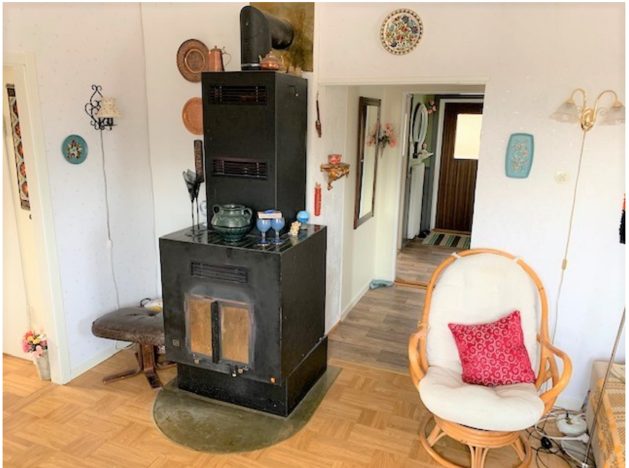
Vardagsrum med Kamin