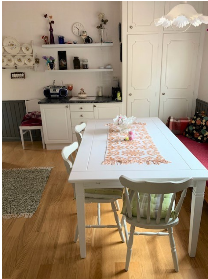
Kök / Matplats