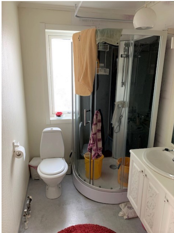
Toalett med dusch & tvättställ