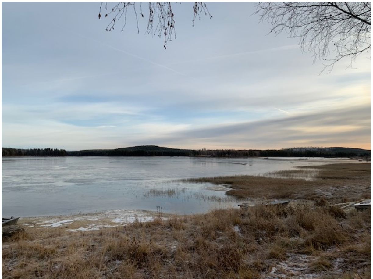
Utsikten - Vindelälven