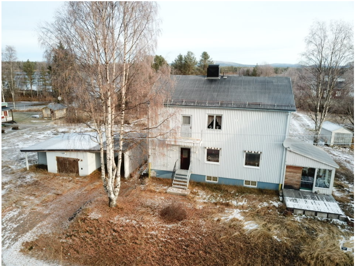
Bostadshuset med tillhörande garage & förråd