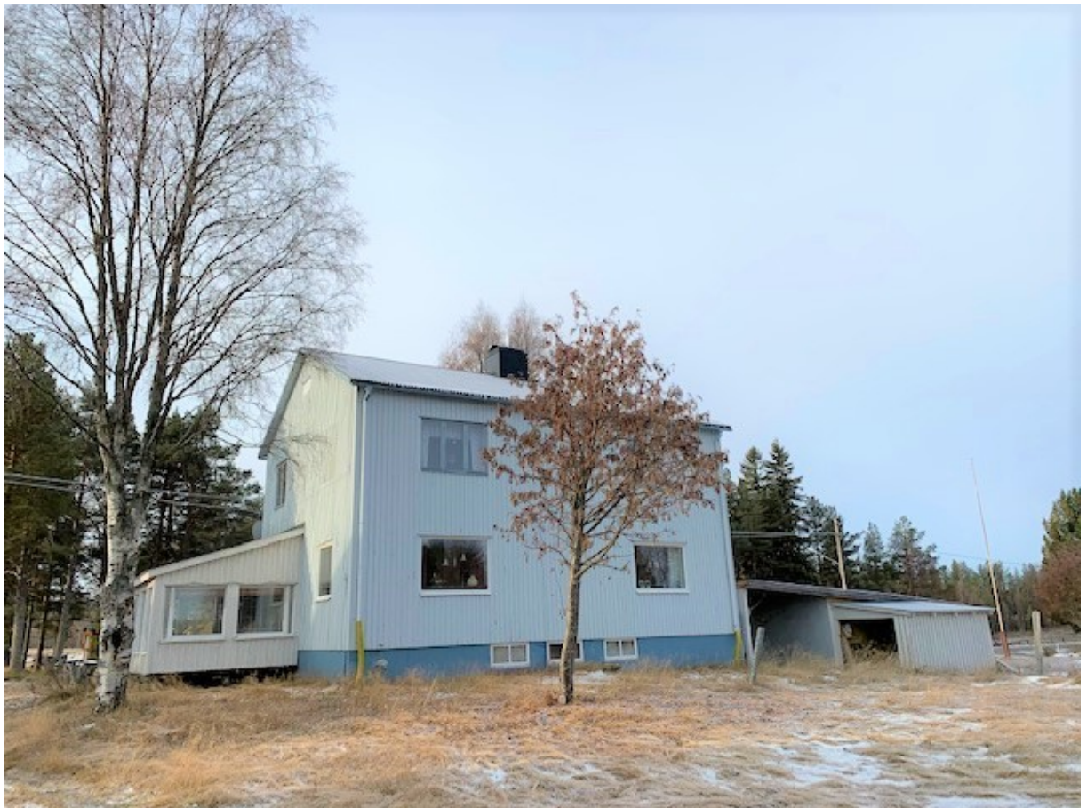
Bostadshuset med tillhörande garage & förråd