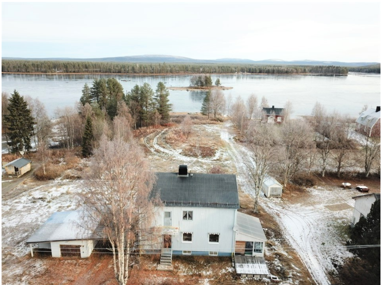
Bostadshuset med tillhörande garage & förråd