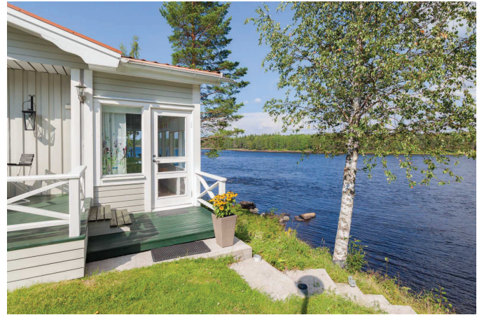
Stuga 2 med inglasat rum