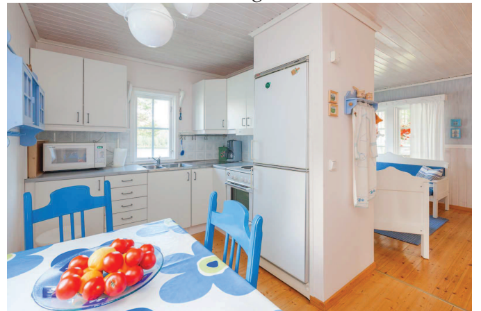
Kök med matplats stuga 1