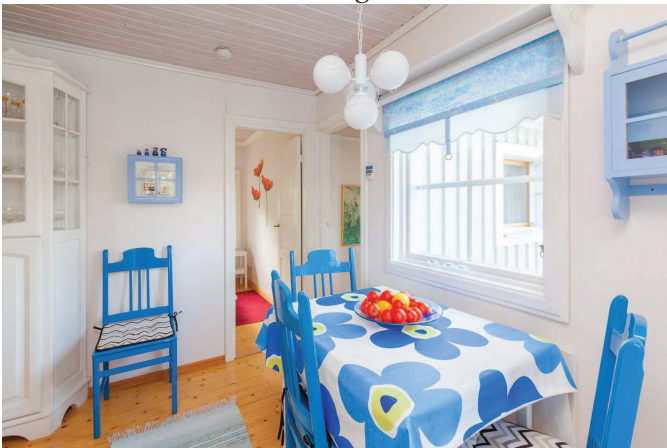
Kök med matplats stuga 1