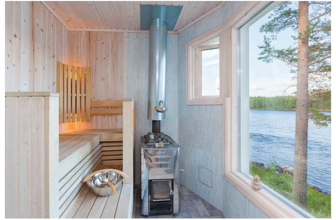
Bastu stuga 2