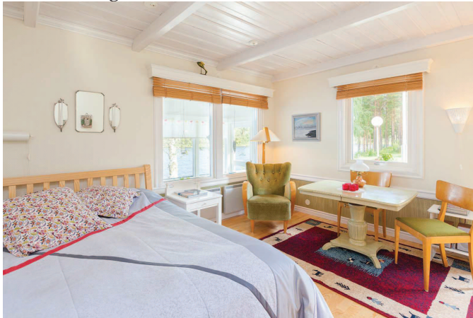
Sovrum stuga 2