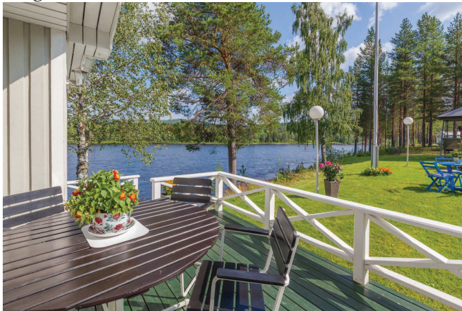
Soldäck stuga 2