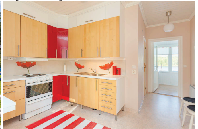
Kök med matplats stuga 2