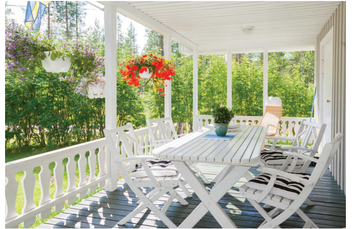
Altan till stuga 1