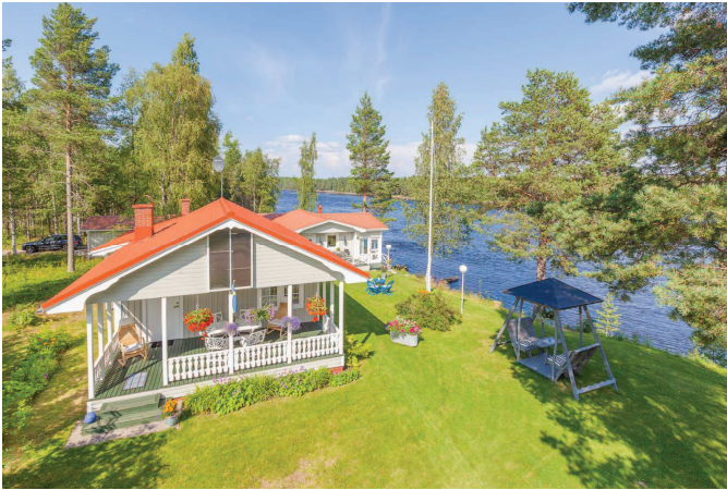
Stuga 1 med stuga 2 i bakgrunden

MäklarTjänst aktiv, ger mer & personligare