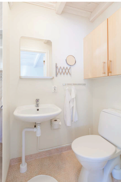
Badrum stuga 1/ Badrum stuga 2