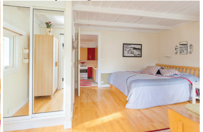
Sovrum stuga 2