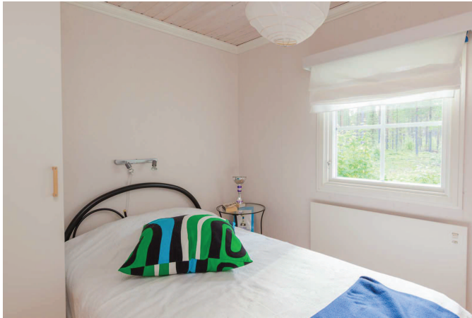
Sovrum (1 av 2) stuga 1

MäklarTjänst aktiv, ger mer & personligare