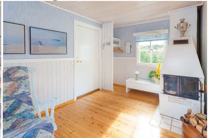
Allrum med braskamin stuga 1