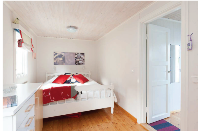
Sovrum (2 av 2) stuga 1