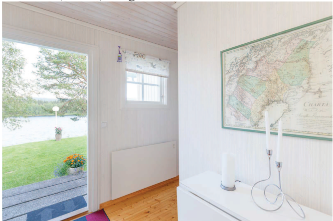
Andra entre till trädgård stuga 1