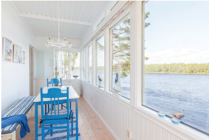
Inglasat rum stuga 2

MäklarTjänst aktiv, ger mer & personligare