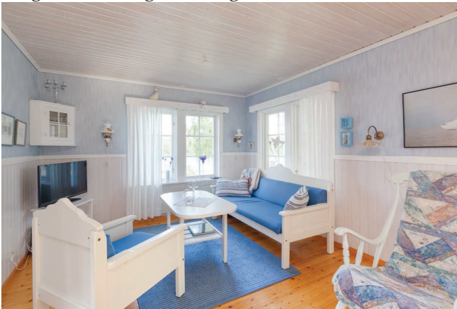
Allrum med braskamin stuga 1